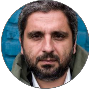
BÜLENT KILIÇ Foto Muhabiri

2003 yılından beri Fransız haber ajansı Agence France-Presse (AFP) için foto muhabirlik yapıyor. 2014 World Press Photo Ödülleri'nde Yılın Haber Fotoğrafı kategorisinde fotoğrafları ile birincilik ve üçüncülük ödülleri aldı. Aynı yıl, Time dergisi ve The Guardian gazetesi tarafından "Yılın En İyi Fotoğrafçısı" seçildi. 2015'te, dünyanın en büyük haber fotoğrafçılığı festivali kabul edilen "Visa Pour l'Image"-da "Türkiye sınırındaki Suriyeli sığınmacılar" konulu foto-röportajıyla büyük ödülü aldı. 2015'te Pulitzer ödüllerinin "feature photography" kategorisinde "Suriye-Türkiye sınırında, küçük Kürt kasabalarındaki IŞİD saldırılarından kaçan Kürtlerin etkileyici fotoğrafları için" aday gösterildi. 2016 World Press Photo Ödülleri'nde Spot Haber/ Foto-Hikâye dalında üçüncülük kazandı.